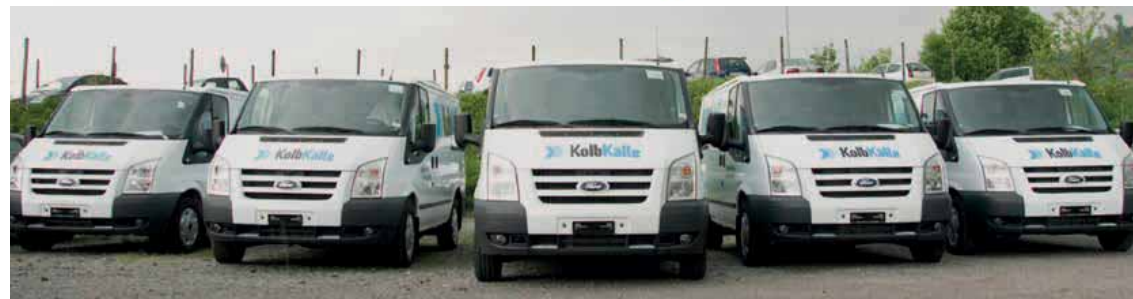
L'équipe de techniciens de service de Kolb Kälte compte désormais 21 techniciens en réfrigération suite à la reprise des actifs de A+E Bäckereikälte SA. L'équipe de service Pitec, composée de spécialistes en boulangerie et en réfrigération, compte désormais à 58 techniciens.