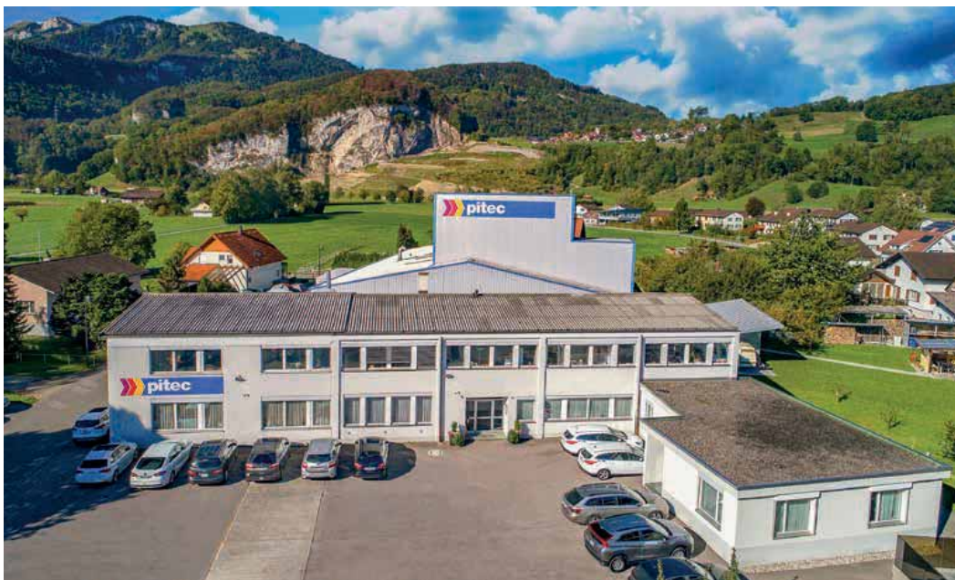
Le siège principal de Pitec se situe Oberriet SG, avec d'autres sites à Rüthi SG, Gränichen, Villars Ste-Croix et un nouveau à Buchs AG.